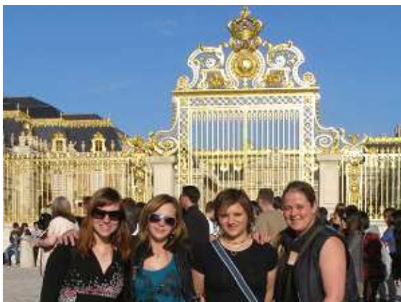
Zájezd do Paříže